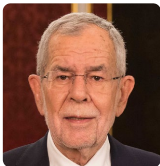
Dr. Alexander Van der Bellen Bundespräsident